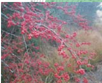
ウメドトキ(実・冬季)