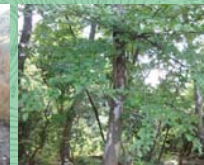
ナツツバキ(幹肌の模様)