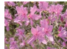
コバノミツバツツジ(4月)