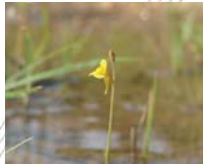
ミミカキグサ(花9月)