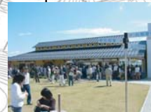
せらワイナリーショップ