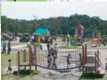
せらミニチュアガーデン