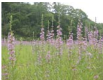
湿生花園・田んぼ観察園