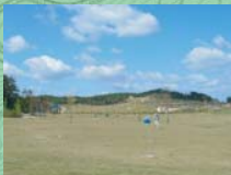
レクリエーション広場