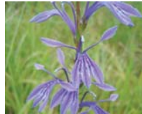
サワギキョウ(花9月)