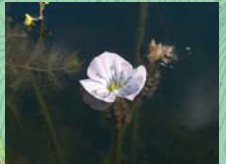
ミズオオバコ(花9月)