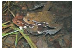
ニホンヒキガエル(産卵2月)