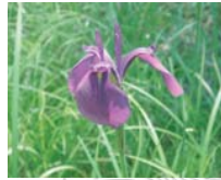
ハナショウブ(花7月)