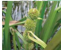
ヤマトミクリ(花7月)