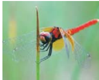
ハッチョウトンボ(7月)