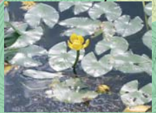
オグラコウホネ(花7月)