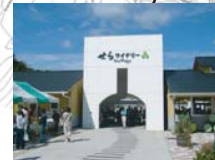
せらワイナリー入口