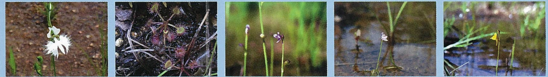
●サギソウ(花8月) ●モウセンゴケ(花7月) ●ムラサキミカグサ(花9月) ●ホザキミカグサ(花9月) ●ミミカグサ(花9月)

世羅台地の湿地は、貧栄養な水がしみ出ている浅い谷間の緩やかな傾斜地に広がっています。サギソウやモウセンゴケなど特有の植生が発達し、絶滅が心配される“湿地の蝶”ヒヨモンモドキも生育しています。園内の湿地植生は、世羅台地内の消えつつある湿地から少量ずつ移植してきたもので、多様な湿地の動植物を保全・育成することを目指しています。