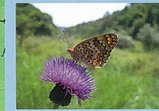
★ヒヨモンモドキ(6月)