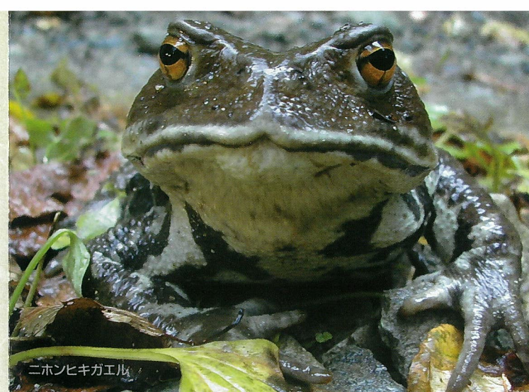
ニホンヒキガエル