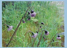
●キセルアザミ(花9月)