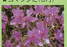
●コバノミツバツツジ(花4月)