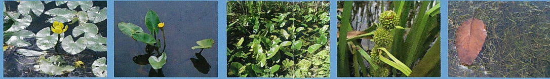
●オグラコウホネ(花7月) ●コウホネ(花7月) ●ヒメコウホネ(花7月) ●ヤマトミクリ(花7月) ●イトモ

田んぼの水源として、古くから人々はため池をつくって利用してきました。ため池は多くの生きものが成育場所や繁殖場所として利用しており、世羅台地の自然を特徴づけています。園内には5つのため池がありますが、水深に変化を持たせ、また山とのつながりを確保することで、多様な動植物が生育・生息できるようにしています。