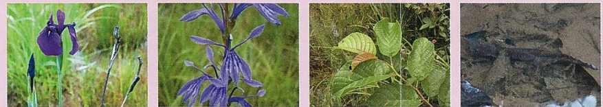
●ノハナショウブ(花7月) ●サワギキョウ(花9月) ●サクラバナンノキ ●カスミサンショウウオ

田んぼには多くの生きものが暮らしています。昔の田んぼは「ひよせ」と呼ばれる小さな水路に冬場も水がたまっており、水生昆虫の越冬場所、カエルやカスミサンショウウオの産卵場所となっています。ここでは、様々な田んぼの生きものや、湿生植物の美しさを楽しむ環境づくりを目指しています。