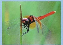
●ハッチョウトンボ(7月)