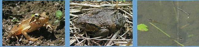
●ニホンアカガエル ●ニホンヒキガエル ●メダカ