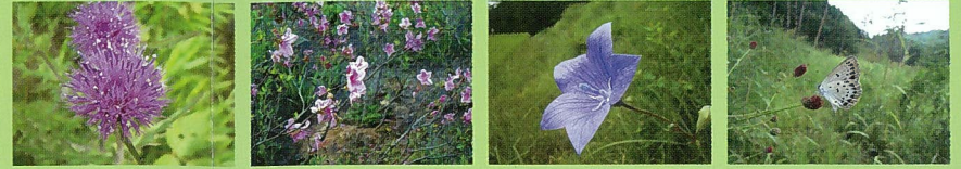
●ノアザミ(花6月) ●キシツヅジ(花5月) ●キキョウ(花8月) ●フレモコウ(花9月) ★ゴマシジミ(9月)

古くから人々は生活に必要な燃料や肥料、牛馬の飼料として山林や畦畔から薪や落ち葉、刈草を採取し利用してきました。こうした人々の営みが、明るい林床や草道を維持し、多様な動植物を育んできました。園内でも定期的に草刈りなどを行っています。