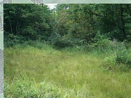
天然の湿原(世羅台地)

しかし近年は、開発や私たちの暮らしの変化によって「里」の環境は減少し、絶滅の心配される生きものが数多くいます。