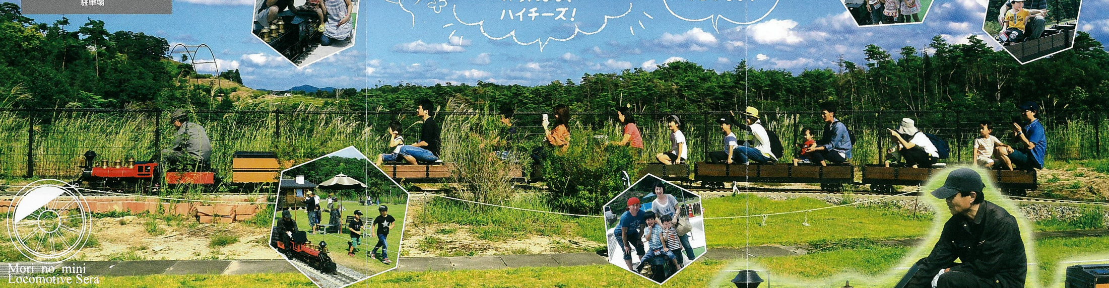
Mori no mini Locomotive Sera

大西部開拓時代、アメリカの大地を疾走したボールドウィンモーガルの、アメリカンスタイルロコの特徴である、前方へ突き出たカウキャッチャー、黒煙を吹き上げる大きなダイヤモンドスタック型の煙突、特徴的な大きなヘッドライト、あの西部劇に登場する当時の機関車の雰囲気での登場です。