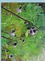
キセルアザミ(花9月)