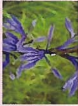
ササギキョウ(花9月)