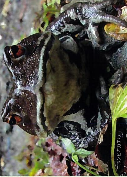
ニホンヒキガエル