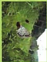
カシモコウ(花9月) コアサジミ(9月)