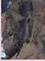
カスミサソウコウオ