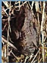
ニホンヒキガエル