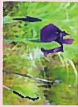
ハイソウコウオ(花7月)

田んぼには多くの生きものが暮らしています。昔の田んぼは「ひよせ」と呼ばれる小さな水溜に冬場も水がたまっており、水生昆虫の越冬場所、カエルやカスミサソウコウオの産卵場所となっています。ここでは、様々な田んぼの生きものや、湿生植物の美しさを楽しむ環境づくりを目指しています。