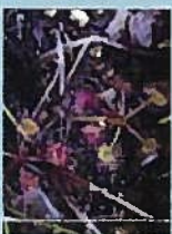
モウセンコケ(花7月)