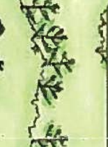
ユビミツリ(ツツシ)(花4月)