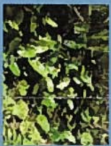
ヒメコウホネ(花7月)