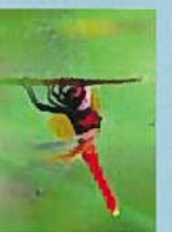
ハツチヨウトンボ(7月)

●園内で生育・生息が確認されている生きもの。★将来的に園内での生育・生息を目指す生きもの。