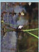
ホウキノミカキガサ(花9月)