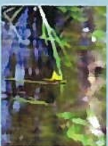
ミミカキガサ(花9月)