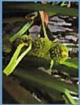
ヤマトミヅカメ(花7月)