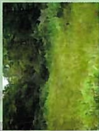
天然の湿原（世羅台地）

しかし近年は、開発や私たちの暮らしの変化によって「里」の環境は減少し、絶滅の心配される生きものも数多くいます。