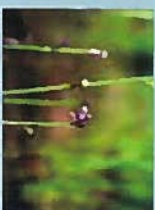
ムラサミカキガサ(花9月)