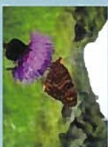
ヒョウモンノドキ(6月)