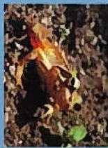
ニホンアマガエル