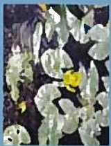
オクラコウホネ(花7月)

田んぼの水源として、古くから人々はため池をつくって利用してきました。ため池は多くの生きものが成育場所や繁殖場所として利用しており、世羅台地の自然を特徴づけています。園内には5つのため池がありますが、水深に変化を持たせ、また山とのつながりを確保することで、多様な動植物が生育・生息できるようにしています。