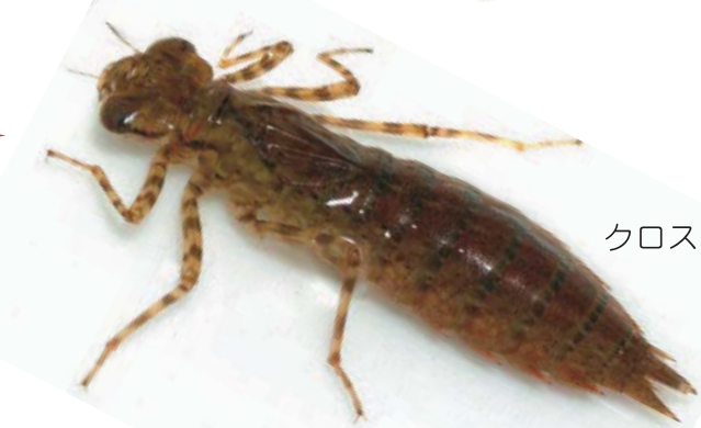
クロスジギンヤンマ