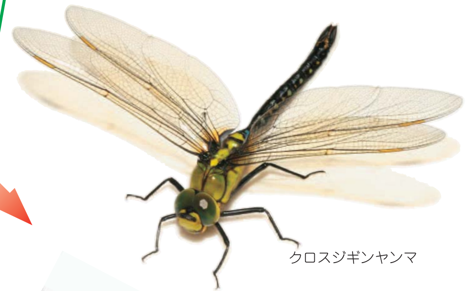
クロスジギンヤンマ