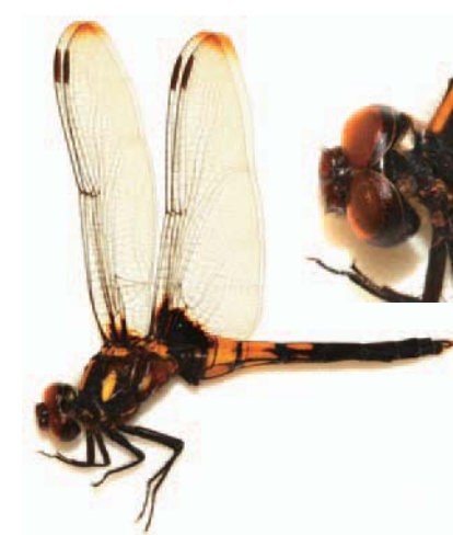
オオシオカラトンボ：オス