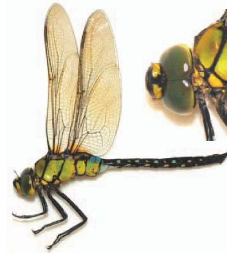
クロスジギンヤンマ：オス