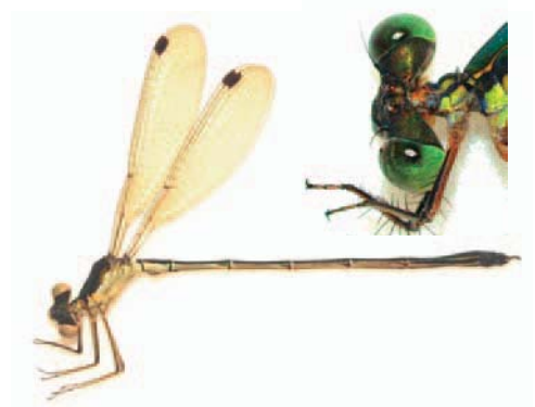
オオアオイトトンボ：オス