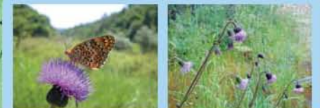
★ヒヨウモンモドキ(6月) ●キセルアザミ(花9月)