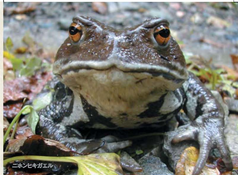
ニホンヒキガエル

ホームページ http://www.serawinery.jp/sdp/index.html