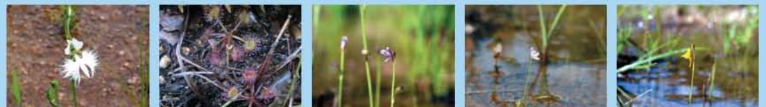
●サギソウ(花8月) ●モウセンゴケ(花7月) ●ムラサキミカグサ(花9月) ●ホザキミカグサ(花9月) ●ミミカグサ(花9月)

世羅台地の湿地は、栄養豊富な水がしみ出ている浅い谷間の緩やかな傾斜地に広がっています。サギソウやモウセンゴケなど特有の植生が発達し、絶滅が心配される“湿地の塔”ヒヨウモンモドキも生育しています。園内の湿地植生は、世羅台地内の消えつつある湿地から少しずつ移植してきたもので、多様な湿地の動植物を保全・育成することを目指しています。