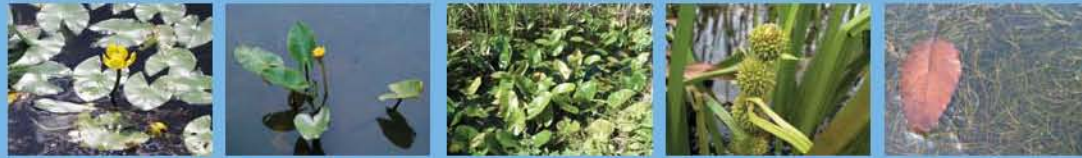
●オグラコウホネ(花7月) ●コウホネ(花7月) ●ヒメコウホネ(花7月) ●ヤマトミクリ(花7月) ●イトモ

田んぼの水源として、古くから人々はため池をつくって利用してきました。ため池は多くの生きものが成育場所や繁殖場所として利用しており、世羅台地の自然を特徴づけています。園内には5つのため池がありますが、水深に変化を持たせ、また山とのつながりを確保することで、多様な動植物が生育・生息できるようにしています。