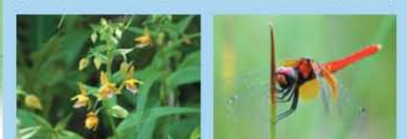
●カキラン(花6月) ●ハッチョウトンボ(7月)