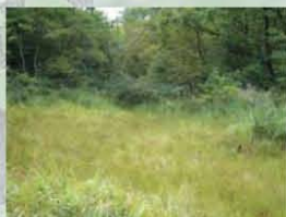
天然の湿原（世羅台地）

しかし近年は、開発や私たちの暮らしの変化によって「里」の環境は減少し、絶滅の心配される生きものが数多くいます。