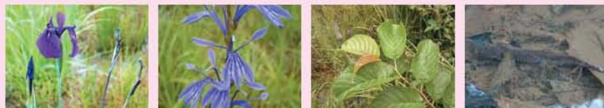
●ノハナショウブ(花7月) ●サワギキョウ(花9月) ★サクラバハナムキ ●カスミサンショウウオ

田んぼには多くの生きものが暮らしています。昔の田んぼは「ひよせ」と呼ばれる小さな水路に冬場も水がたまっており、水生昆虫の越冬場所、カエルやカスミサンショウウオの産卵場所となっています。ここでは、様々な田んぼの生きものや、湿生植物の美しさを楽しむ環境づくりを目指しています。