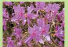
●コバノミツバツツジ(花4月)