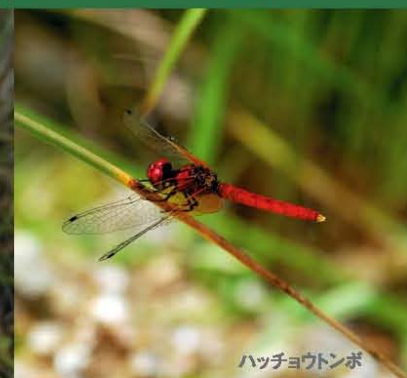
ハッチョウトンボ