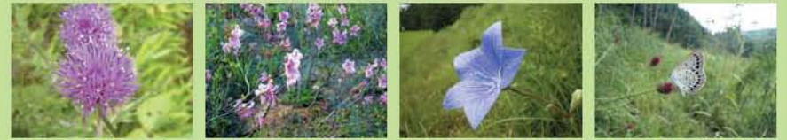
●ノアザミ(花6月) ●キシツツジ(花5月) ●キキョウ(花8月) ●フレモコウ(花9月) ★ゴマシジミ(9月)

古くから人々は生活に必要な燃料や肥料、牛馬の飼料として山林や畦畔から薪や落ち葉、刈草を採取し利用してきました。こうした人々の営みが、明るい林床や草地を維持し、多様な動植物を育んできました。園内でも定期的に草刈りなどを行っています。