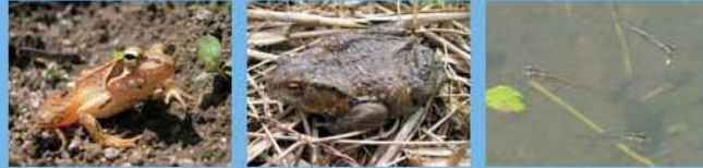
●ニホンアカガエル ●ニホンヒキガエル ●メダカ