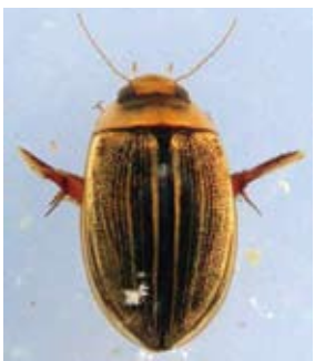
コシマゲンゴロウ