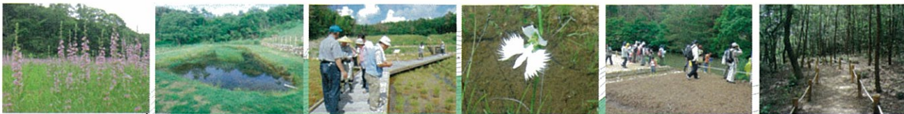
湿生花園・田んぼ観察園 ため池 湿地・湿原 サギソウ(花・8月) トンボ池 雑木林の散策路