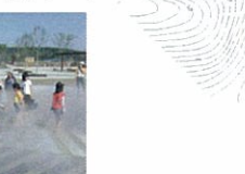
せらミニチュアガーデン