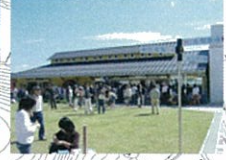
せらワイナリーショップ