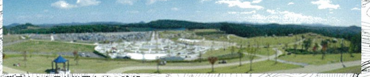
夢見山から見た世羅台地の眺望