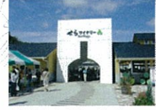
せらワイナリー入口