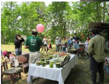
昨年開催した“せらの山へいってみよう～春～”の様子