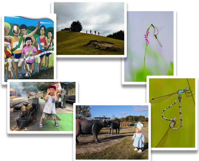
※写真 第3回フォトコンテストの入賞作品