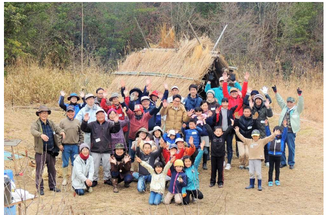
↑参加者全員で記念撮影。去年と同じ顔ぶれも大勢写っています。