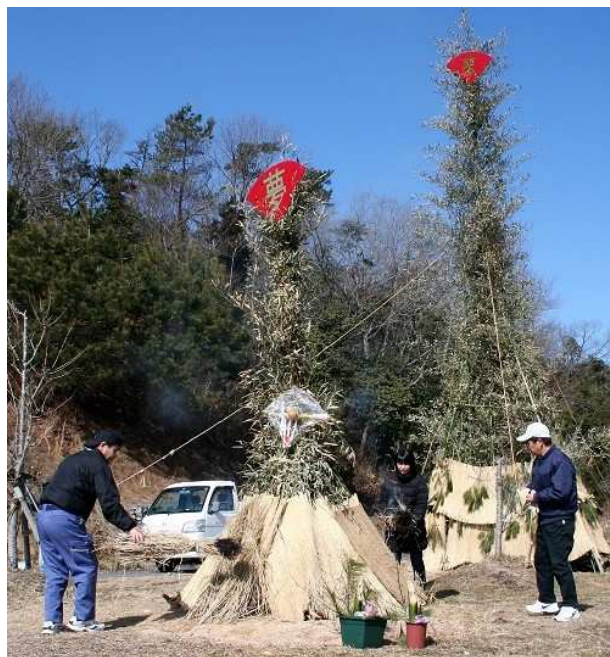
↑年男、年女の方に点火をお願いしました。

2月18日(日)、せらワイナリーで夢とんどを開催しました。とんどを立てたのは2月9日で、その後、雪が降ったり強風に見舞われたりしましたが、どうにか本場を迎え、多くの来場者で賑わいました。