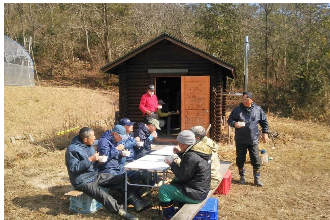
↑天気がいいのでランチタイムは外で。