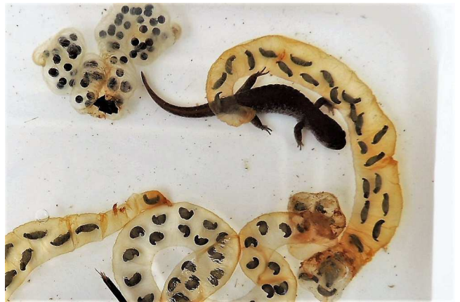
↑3月7日に見つけたカスミサンショウウオと卵のう。

3月1日(木)にはアカガエルの卵塊を、3月7日(水)にカスミサンショウウオの卵のうと成体を確認しました。