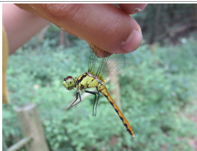
里山の散策道にヒメアカネのオス