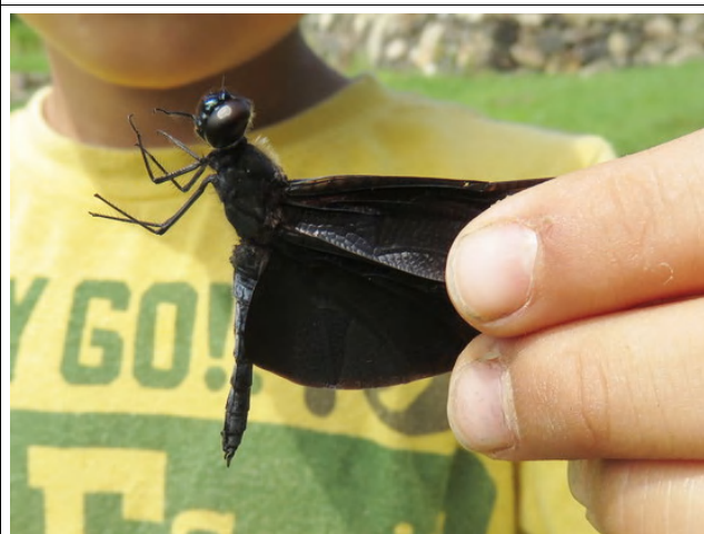
ため池でチョウトンボをゲット！