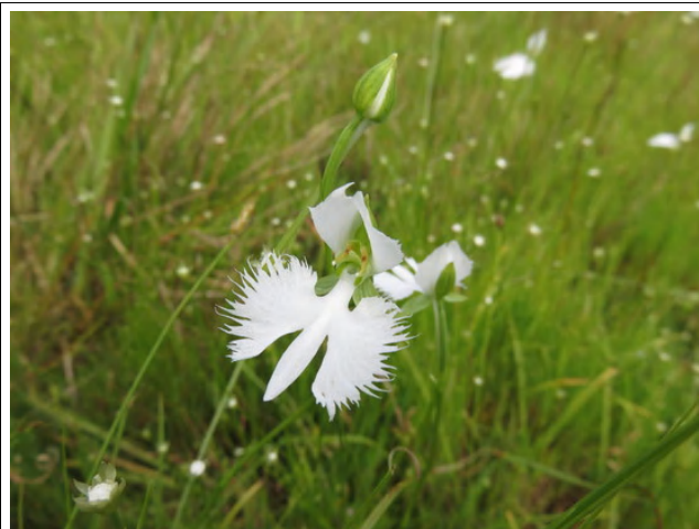
今年もサギソウが咲きました

今年の夏も貧栄養湿地エリアではサギソウの花を 1,000 輪以上数えることができました。ガイドウオークではのんびり草原、里山の散策道、自然観察園の園路や水路など、いろんな場所で生きものたちを見ることができました。夏の暑さは一時期よりもしのぎやすくなり、秋の訪れを感じ始めることができた観察会となりました。