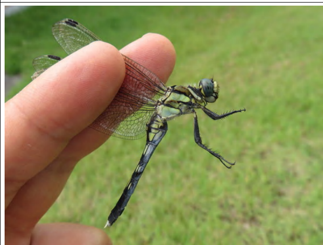
のんびり草原にシオカラトンボのメス