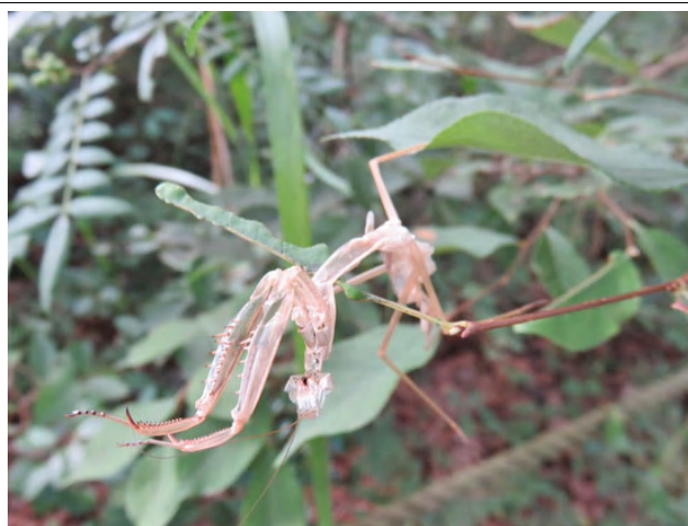
里山の散策道でカマキリの抜け殻