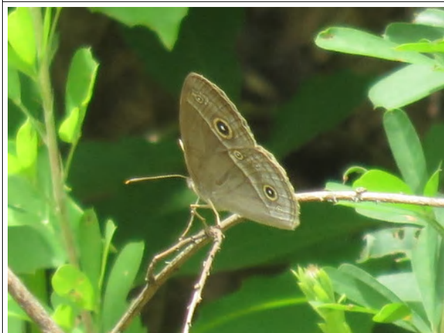
目玉模様が特徴的なヒメジャノメ