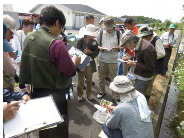
フィールドでチョウを観察しながら学びます

お天気にも恵まれ、季節のチョウを確認できたフィールドワーク。前回の宿題で、日々で見られるチョウを写真を撮るなど調べていた受講者のみなさんも、少しずつチョウを見る目が養われているのを感じました。