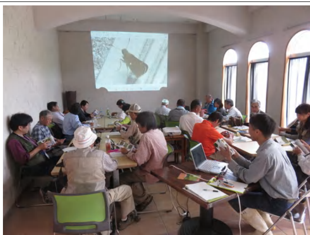
みんなで各自撮ってきたチョウの名前調べ