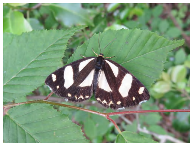
きれいな蛾の1つ、キンモンガ