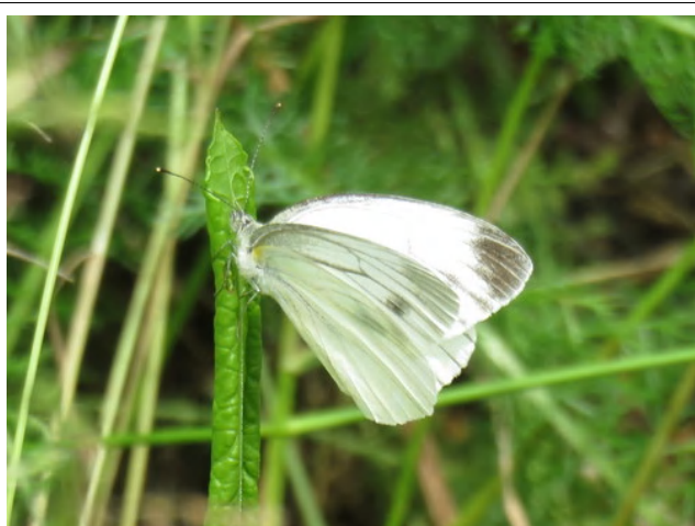
はねに黒い筋が入るスジグロシロチョウ