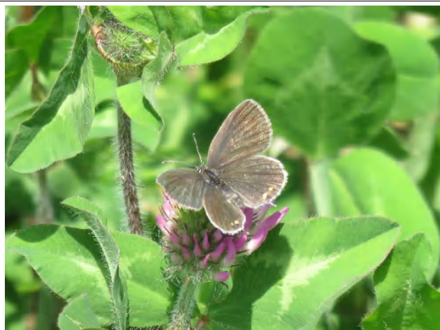
後翅の尾状突起が特徴的なツバメシジミ