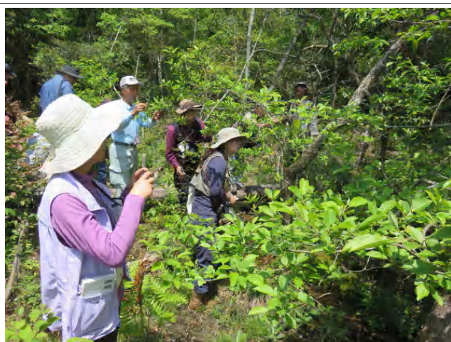
ハンノキ類でミドリシジミの幼虫探し