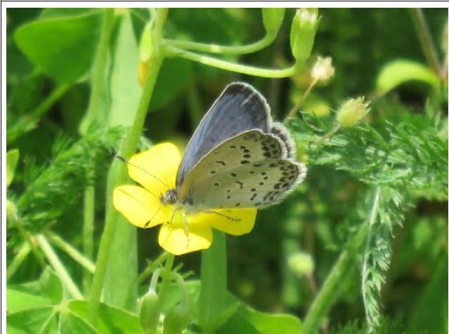
幼虫はカタバミを食べるヤマトシジミ