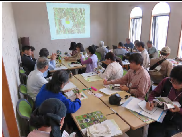
図鑑を見ながら撮ったチョウの名前調べ