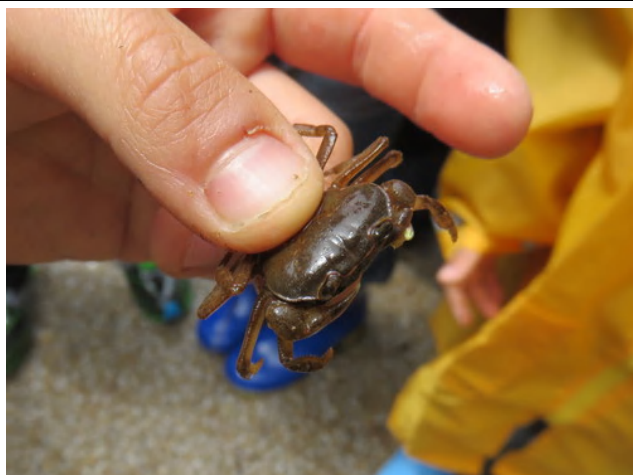
水辺ではサワガニを発見！