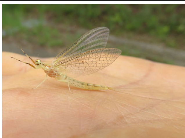
羽化したばかりのカゲロウのなかま