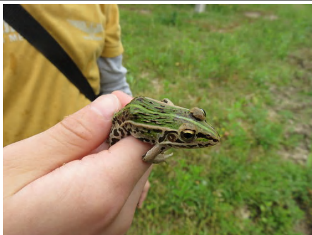
トノサマガエルもいました！