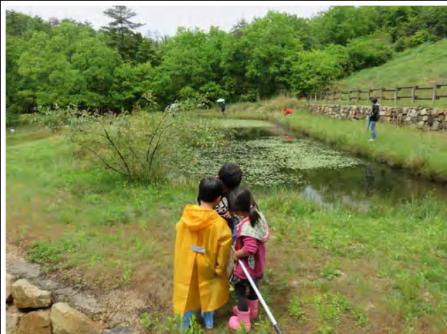
ため池や里山で生きものさがし！

朝からの雨も止んで、青空ものぞいた5月の自然観察園ウォーキング。のんびり里山を歩きながら、子どもたちは生きものさがしてあそびます。カエルやおたまじゃくしといった水辺の生きものたちや、晴れてくるとトンボたちも出てきて観察できました。初夏の生きものたちをゆっくりと楽しんだ観察会となりました。