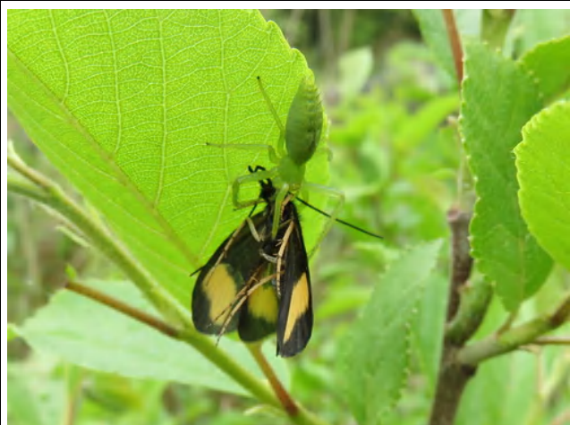
トビケラのなかまを捕まえたクモ