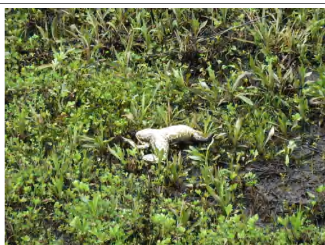
ひっくり返ったウシガエルにびっくり！