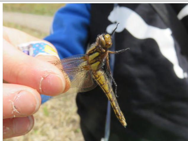
シオヤトンボがもう羽化してきていました