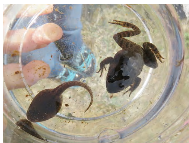
ツチガエルのおたまじゃくしと成体