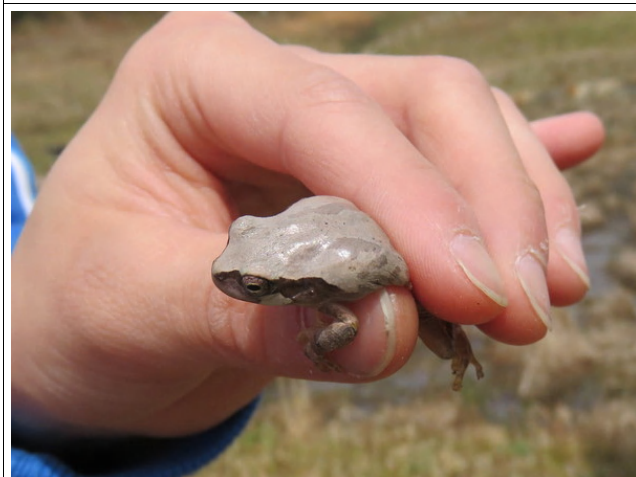
アマガエルもたくさん見つかりました