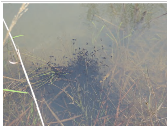
ヒキガエルのおたまじゃくしの群れ

寒暖の差が激しく、ぐっと気温の上がる日が多いこの春。生きものたちもどんどん姿を現してきています。カエルもアマガエルやツチガエル、ウシガエルを捕まえて、ヒキガエルやニホンアカガエルのおたまじゃくしを観察。シュレーゲルアオガエルやトノサマガエルの鳴き声も聞くことができました。春一番に羽化するトンボ、シオヤトンボも見られ、季節の早さを感じます。たくさんの春の生きものたちとふれ合えた観察会となりました。