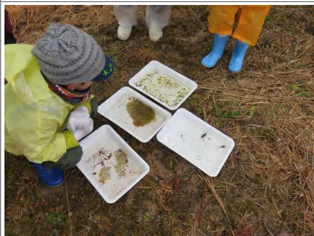
産卵時期によって発生段階が違ってきます