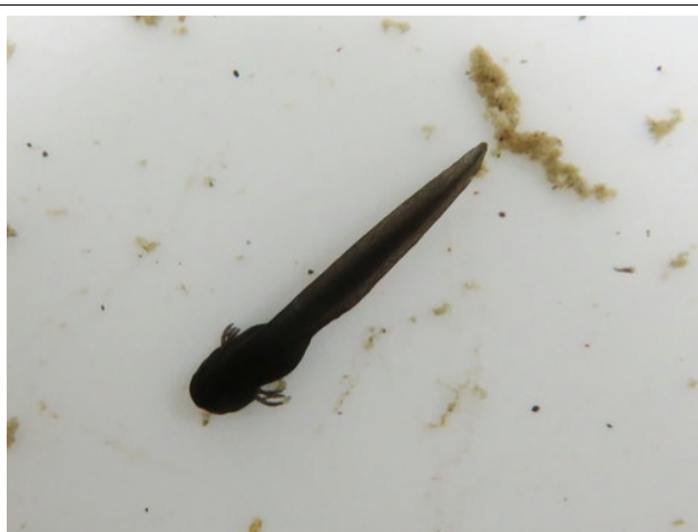
たまごから孵ったばかりのおたまじゃくし