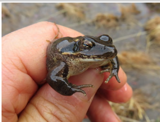
ニホンアカガエルのオス