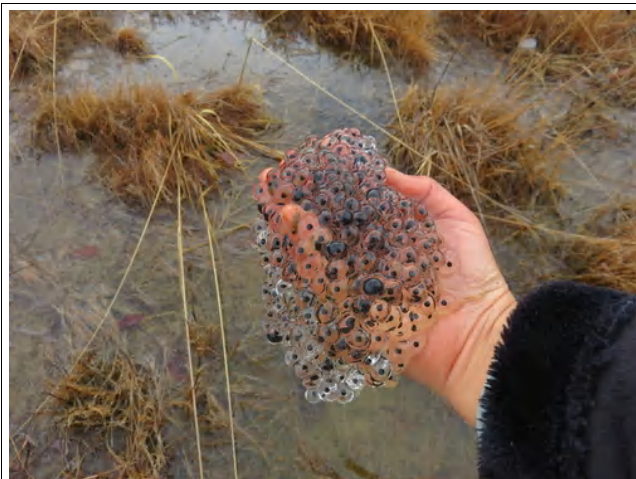
湿地に産んでいたアカガエル類の卵塊

早春の候、湿地に産卵するアカガエル類の観察会。冷たい雨が降るお天気でしたが、湿地でアカガエル類の卵塊やおたまじゃくしのようすを観察。産まれて間もない卵、少し成長した卵、おたまじゃくし、と、ひと雨ごとに産卵のタイミングがずれて、違う成長段階のようすを見ることができました。