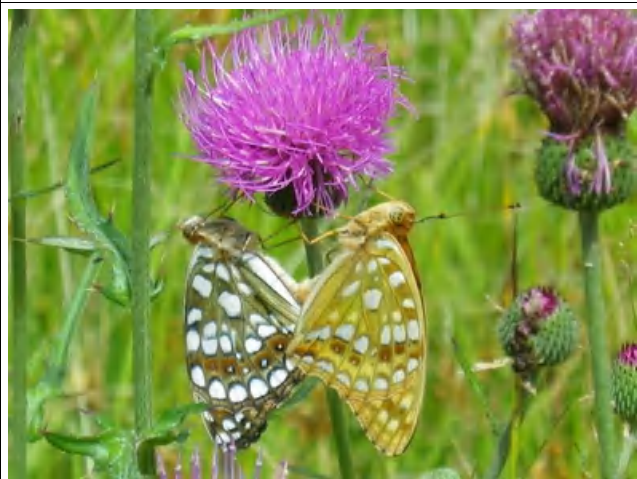
ノアザミの花の下で交尾する ウラギンヒョウモンのメス(左)とオス(右)