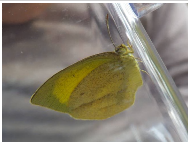
調査以外で見られた絶滅危惧種のチョウ、 ツマグロキチョウ (10月26日)