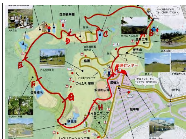
調査ルート(赤線)内には、林内や林縁・湿地・草地といった多様な環境があります

せら夢公園のチョウ類調査は来年以降も継続して行います。自然観察園を歩きながら、自然やチョウを気軽に楽しめるイベントです。みなさまのご参加、情報をお待ちしています！