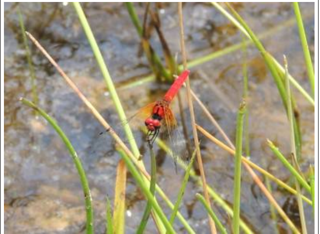
日本一小さなトンボ、ハッチョウトンボ。赤いのがオス