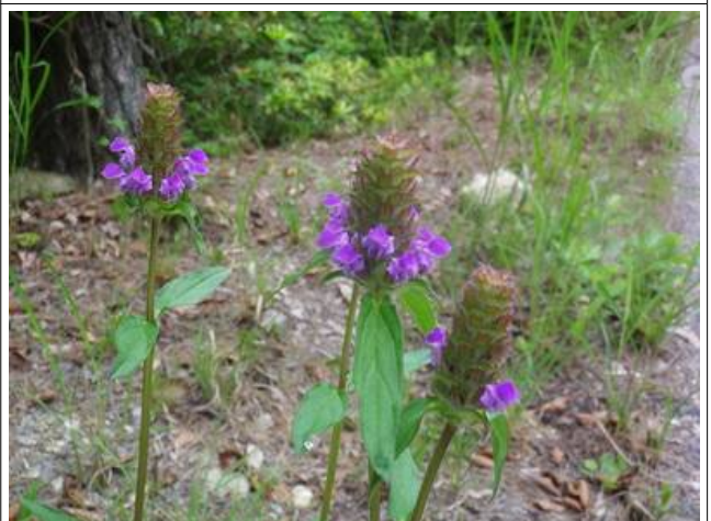
ウツボグサも咲き始めていました