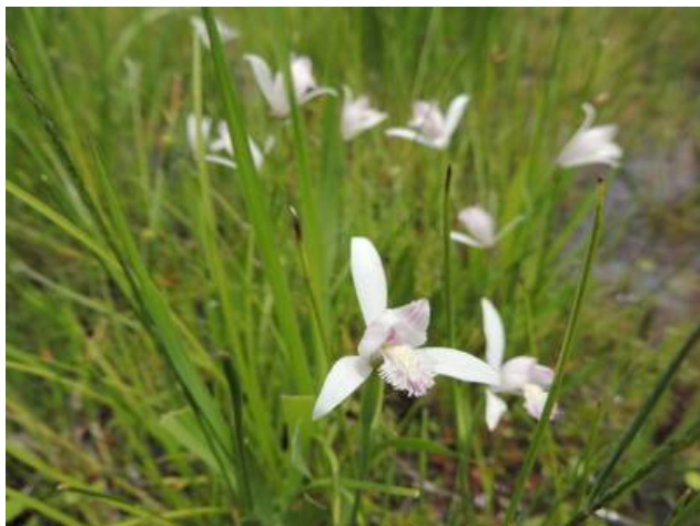
トキソウの花は350輪ほど見れました