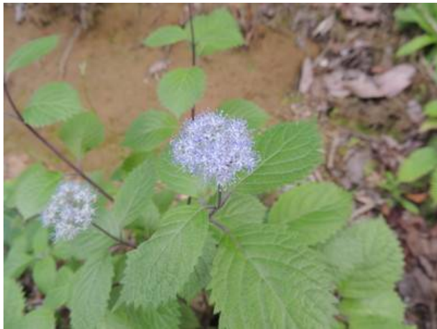
林縁に咲くコアジサイ

当日はホトトギスの鳴き声が時折響く静かな朝。薄曇りのウオーキング日和でした。湿地では今年もたくさんのハッチョウトンボが見られ、トキソウもしっかりと花を咲かせていました。再生湿地の取り組み、生きものたちも順調に増えていっているようです。お昼前に日が射すとハルゼミも鳴き出して、初夏の自然のおもしろさを感じた会になりました。