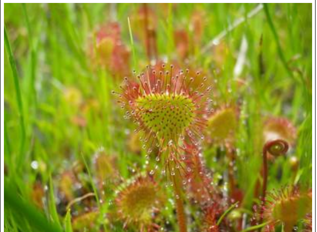
食虫植物のモウゼンゴケ