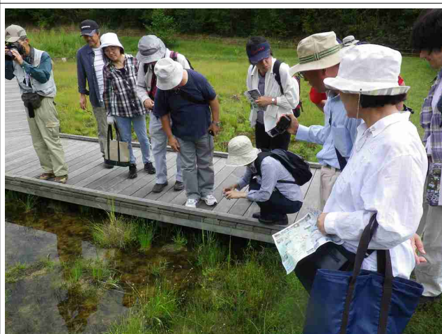
観察会のようす。湿地の生きものをカメラでバチリ