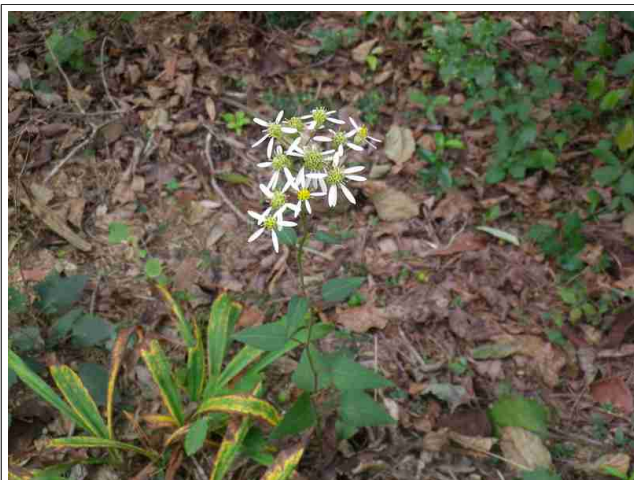
山辺に咲くシラヤマギク

当日は台風の接近もありお天気が心配でしたが、幸い雨も降らず。里山の散策道ではシラヤマギクやママコナ、ツルリンドウ、オミナエシなど秋の花がお出迎え。湿地ではサワギキョウのほか、ミミカキグサ類やホシクサ類など小さくも貴重な花々を観察できました。トンボなどの虫たちも手にとって観察するとおもしろい発見がありますね。秋の自然観察園をまるごと楽しめた観察会となりました。