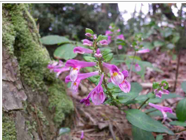
里山の散策道をママコナが彩ります