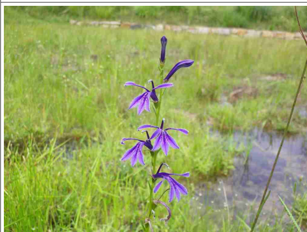
湿地に花を咲かせるサワギキョウ