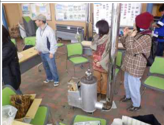
まだ寒い中、ロケットストーブが活躍しました