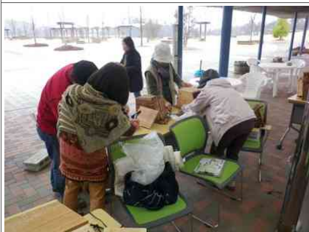
みんなで作ると楽しい時間です