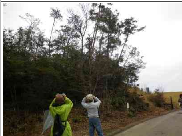
公園を歩きながら野鳥観察です