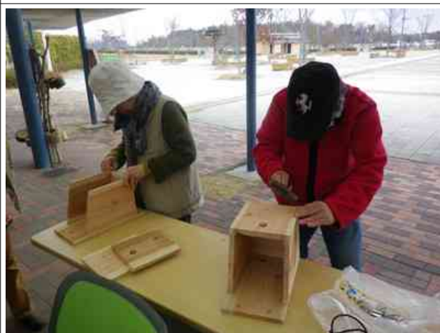
午後は巣箱づくり