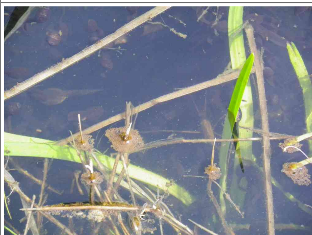
ニホンヒキガエルのおたまじゃくしとミズカマキリ