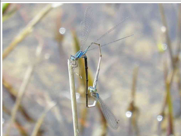
ホソミイトトンボ