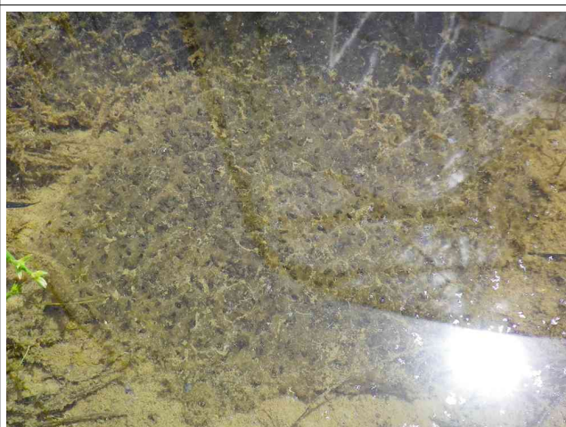
湿地で見られたトノサマガエルの卵塊