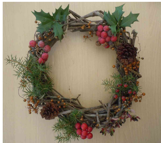
来年もステキな里山を楽しめますように・・・