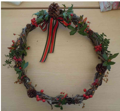
完成したクリスマスリース