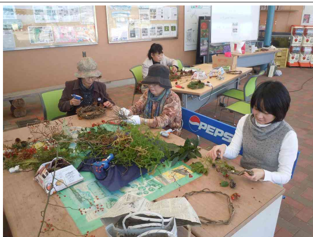
集めた材料でリースづくり