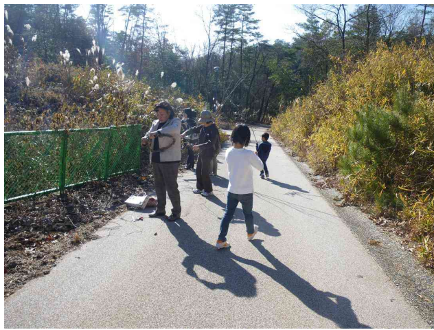
クズのつるでリース台をつくります

「里山のおくりもの」をテーマにクリスマスリースづくりを行いました。新聞紙で作ったエコバックを片手に、園内の里山へ出発！天候にも恵まれ、サルトリイバラやソヨゴの赤い実など、リースの材料を探しながら里山散策を楽しみました。材料も自分たちで集めて作ったリースにはなんとも愛着があります。来年もよき年でありますように祈念です。