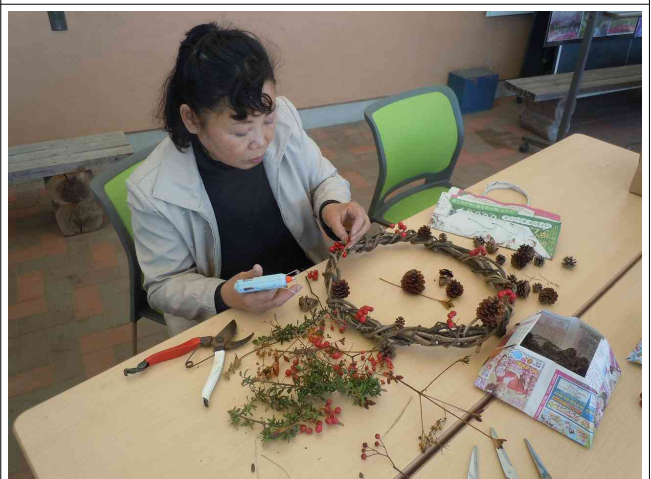
飾りはグルーガンを使って接着させます