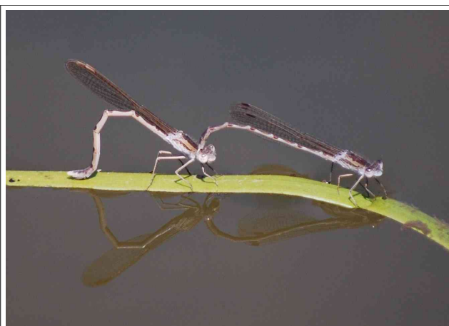
オツネントンボのカップル。左がメスで産卵している。