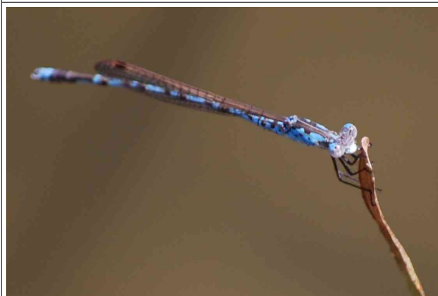
ホソミオツネントンボ(♂)