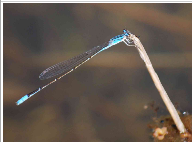
ホソミイトトンボ(♂)