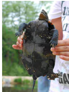
←おなかの側は全面に黒い。