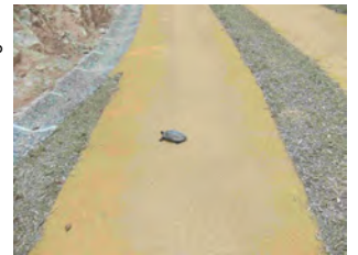
水辺から水辺へと移動します。↑

●ニホンイシガメ(日本石亀) 学名: Mauremys japonica 他の呼び方: ゼニガメ (甲羅が丸くて黄色っぽいから)