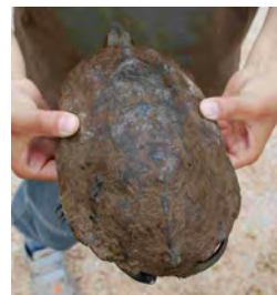
↑イシガメ 子どもだとギザギザがハッキリ(右)