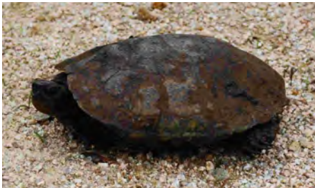
泳ぐのも歩くのも意外とすばやい!

山手の池沼・田んぼなど水辺にすんでいます。日本にしかないカメ! 最近少なくなってきて、広島県では準絶滅危惧種です。