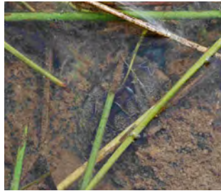
↑ふだんは田んぼや湿地にいます。