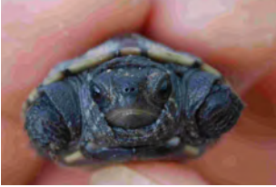
赤ちゃん↑とおとな↓の顔