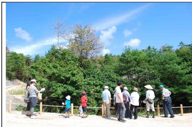
気持ちの良い秋空の下で

※ 後日、中国新聞の「広場」のコーナーに、参加された方の感想が掲載されていました。ありがとうございました。