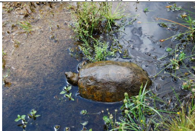
イシガメと3ヶ月ぶりに再会！