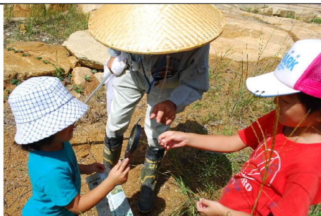
虫メガネで見てみよう！